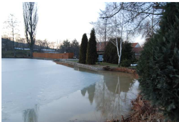
Staw na terenie Gospodarstwa Agroturystycznego „U Krzysztofa”