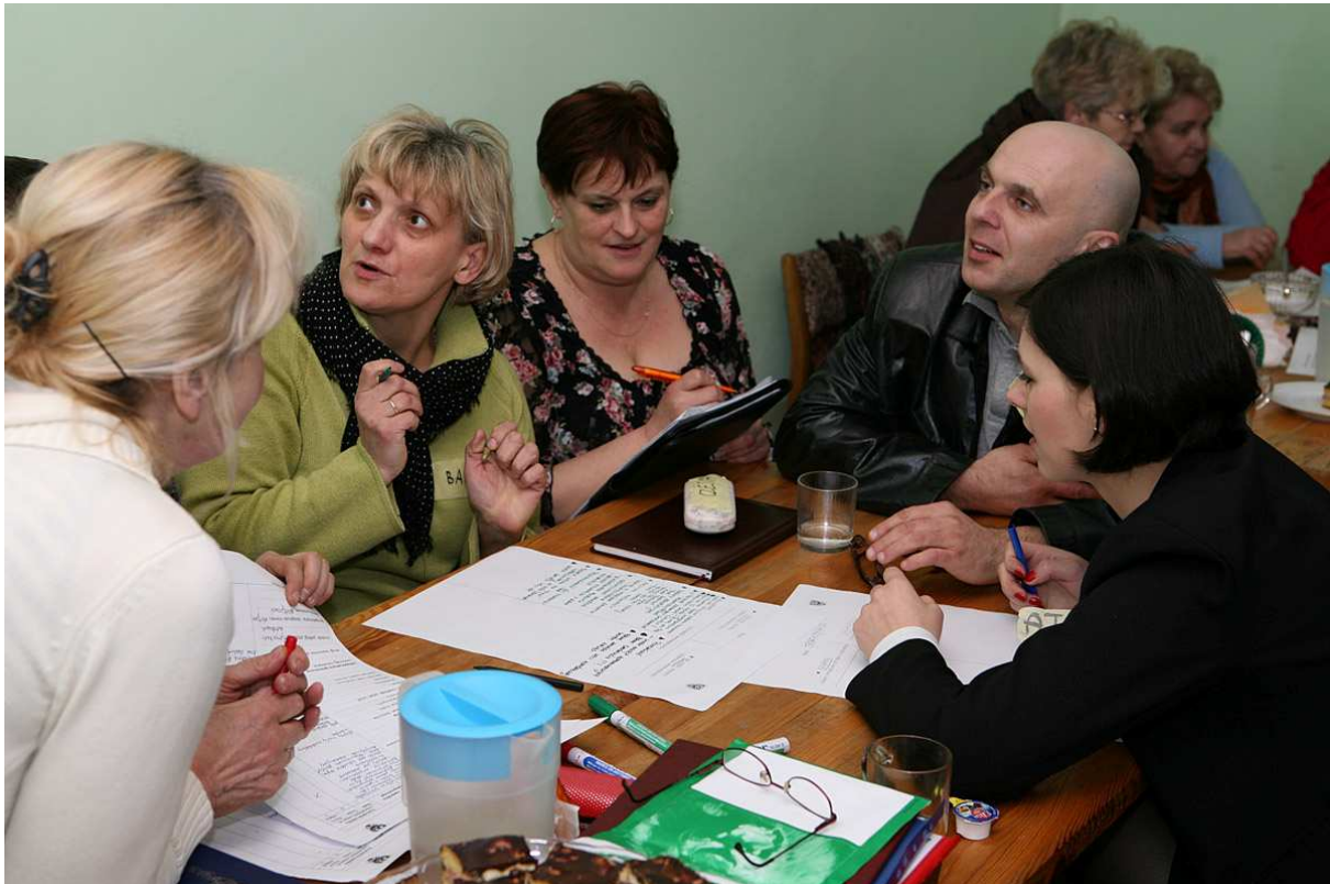
Grupa Odnowy Wsi podczas prac nad Strategią

Jędrzejowice to zadbane i malowniczo położona wieś. Mieszkańcy są szczęśliwi, zintegrowani i aktywnie uczestniczą w życiu swojej miejscowości. Pielęgnowana jest kultura i tradycje rodzinne. Z bogatej oferty baśniowej wsi korzystają mieszkańcy oraz liczni turyści, znajdujący tu miejsce atrakcyjnego i spokojnego wypoczynku.