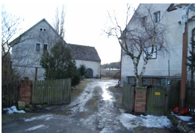
Tradycyjna zabudowa gospodarcza