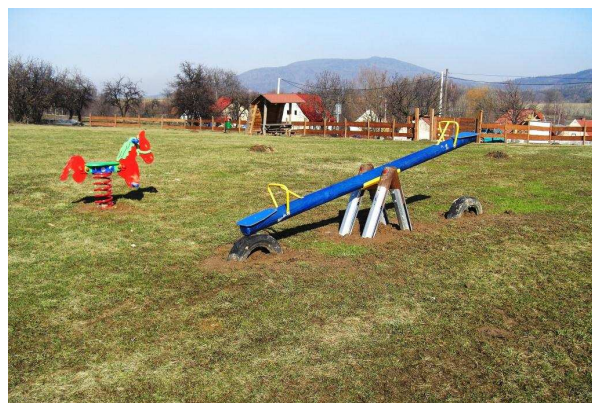
Teren rekreacyjny – plac zabaw