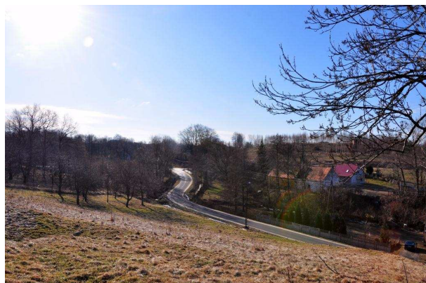
Widok na wieś