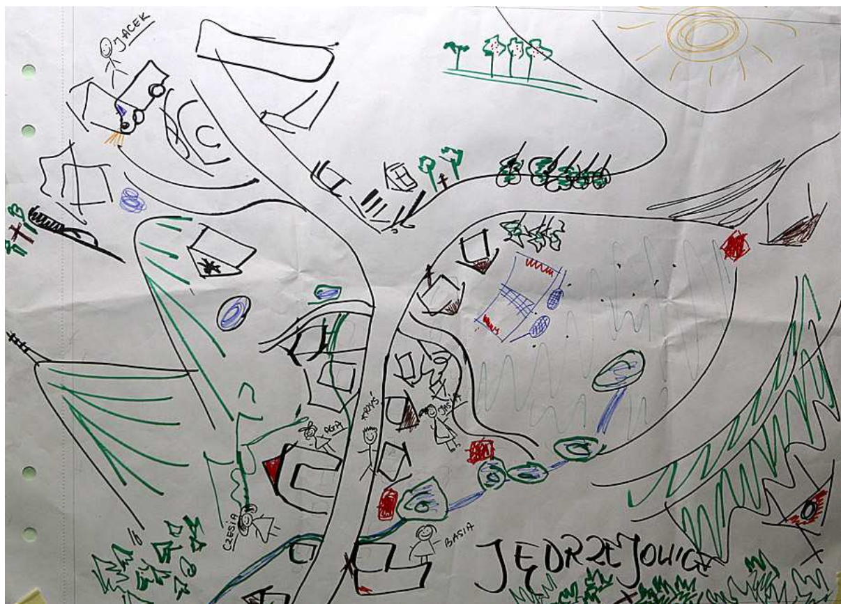
Mapa pogładowa Jędrzejowic