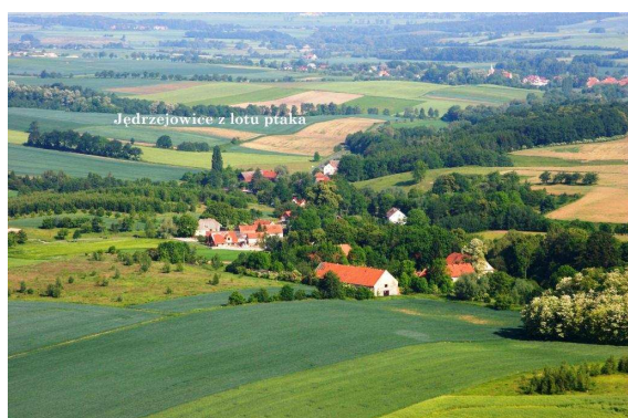
Widok na wieś